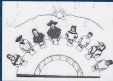
Unidad de Escritores Mayas-Zoques, A.C.